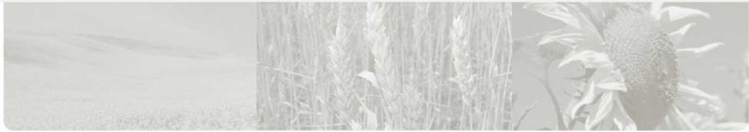
AgroGeneration. Campagne des semis de printemps 2022