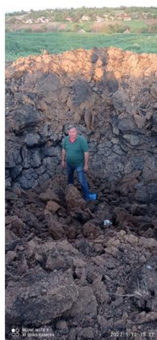
Directeur d'une des fermes d'AGG sur le terrain