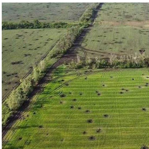
...marqué par des cratères d'obus tombés